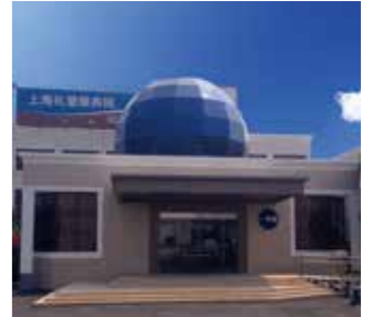
上海礼愛頤養院(中国・上海)