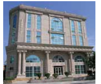
礼愛老年介護中心(中国・成都)