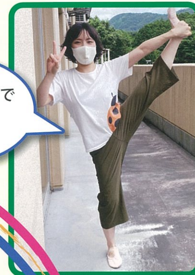
趣味のバレエで 休日も充実 (入職2年目)