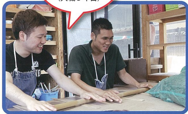
陶芸作業は癒しの時間 (入職3年目)