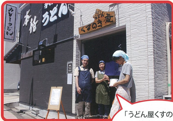
「うどん屋くすのき庵」 では美味しいうどんを 打ってお待ちしております (入職8年目)