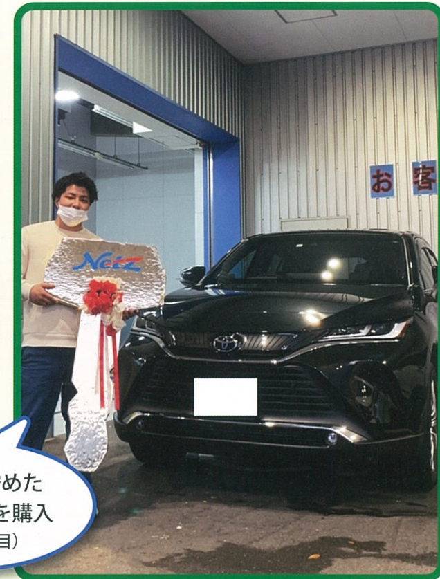
頑張って貯めた お金で新車を購入 (入職5年目)