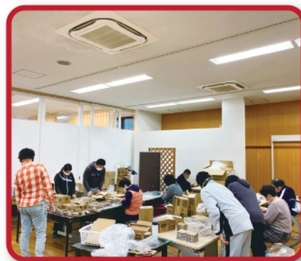
みんなで作業頑張っています! (ワークスペースさつき)