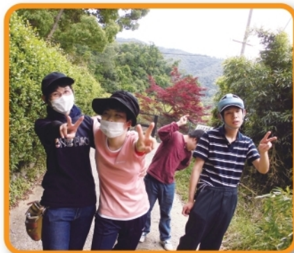
ウォーキング中にハイチーズ (こすもす)