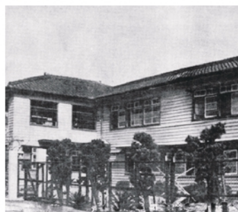
開設されところの養気園