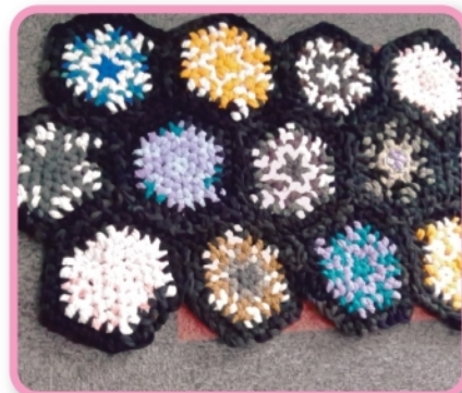
世界で1つだけのものが作れます! (救護三恵園)