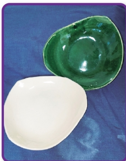
信楽の土を使用し一枚一枚、利用者が丁寧に 作っています。不均一ながらも重ねて収納でき、 軽くて丈夫なお皿です。 (池田三恵園)