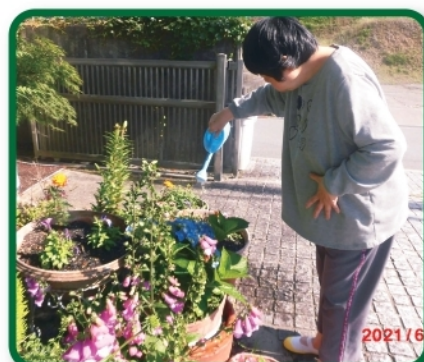
きれいな花が咲きますように。 (第2三恵園)