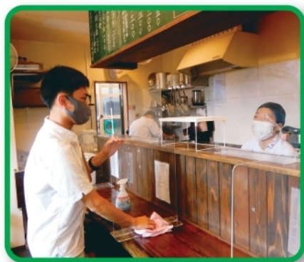
心を込めて開店準備をしています。 (くすのき学園)