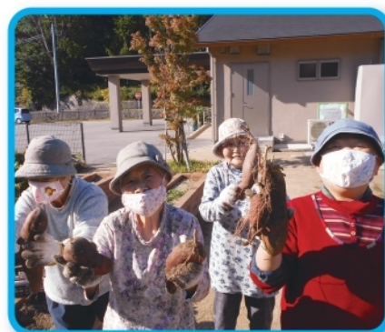
苑庭で育てたサツマイモの収穫。 満面の笑顔で「大きくなったよ〜!」。 (なごみ苑)