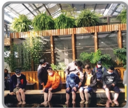
おでかけのひと時 (伏尾台ホーム)