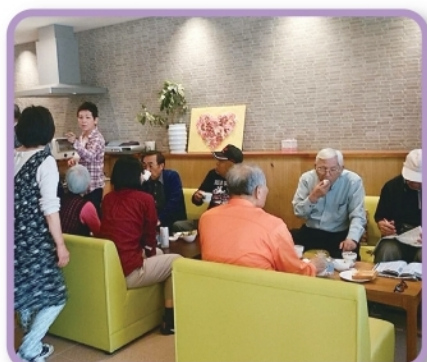
地域の方が交流できる場として「なごみサロン」 を開設しています。 (大里荘)