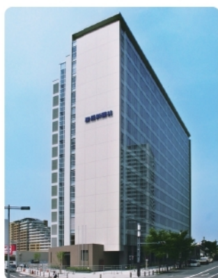
法人本部のある難波サンケイビル

産経新聞厚生文化事業団は、平成30年1月4日、厚生労働大臣から、租税特別措置法施行令第26条の28の2第1項第3号に規定する要件を満たした法人であると認められました。寄付については申告の際に「税額控除」が適用されます。