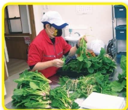
野菜加工の作業にあたる利用者さん。 商品の質が良く、納品先で評判となっている。 (すみれ工房)