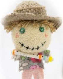
マスコットキャラクター 田中くん